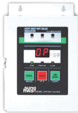
차단 장치 제어부